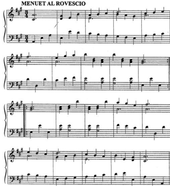
الشكل رقم (٤)